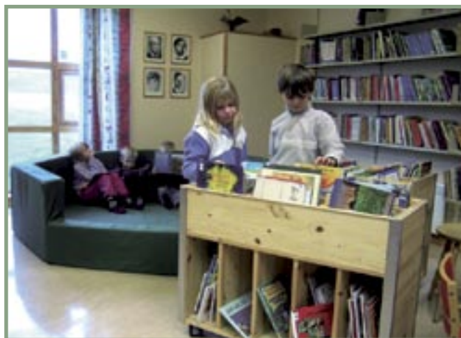
Fra skolebiblioteket ved Utøy skole, Inderøy.

Sør-Trøndelag fylkesbibliotek: Tlf: 72547550 http://www.st.fylkesbibl.no